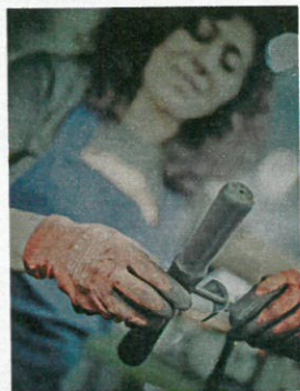
In Sundern werden auch Luftpumpen produziert.

Das Aufpumpen eines Reifens kann anstrengend sein, zumindest, wenn man keine hochwertige Standpumpe nutzt. Das ist eine Spezialität von SKS Germany aus Sundern. Das weltmarktführende Familienunternehmen wird in der vierten Generation geführt. 98 Prozent aller SKS-Produkte werden im Sauerland produziert. „Made in Germany“ spiegelt dabei die hohen Ansprüche an Qualität, Funktion und Design wider. In den Entwicklungs- und Konstruktionsabteilungen werden die Produkte mit Erfahrung und Kreativität entwickelt und auf Herz und Nieren getestet. Rund 340 Mitarbeiter produzieren die qualitativ hochwertigen Zubehörteile auf fast 40.000 Quadratmetern reiner Produktionsfläche und erzielen einen Umsatz von 55 Mio. Euro